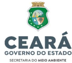
Gouvernement de Ceará